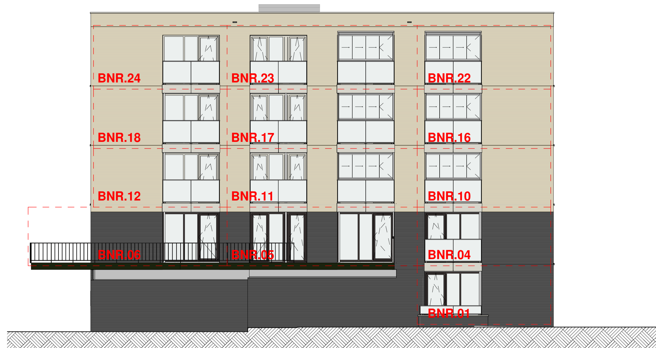
Noord-oost gevel 1:100