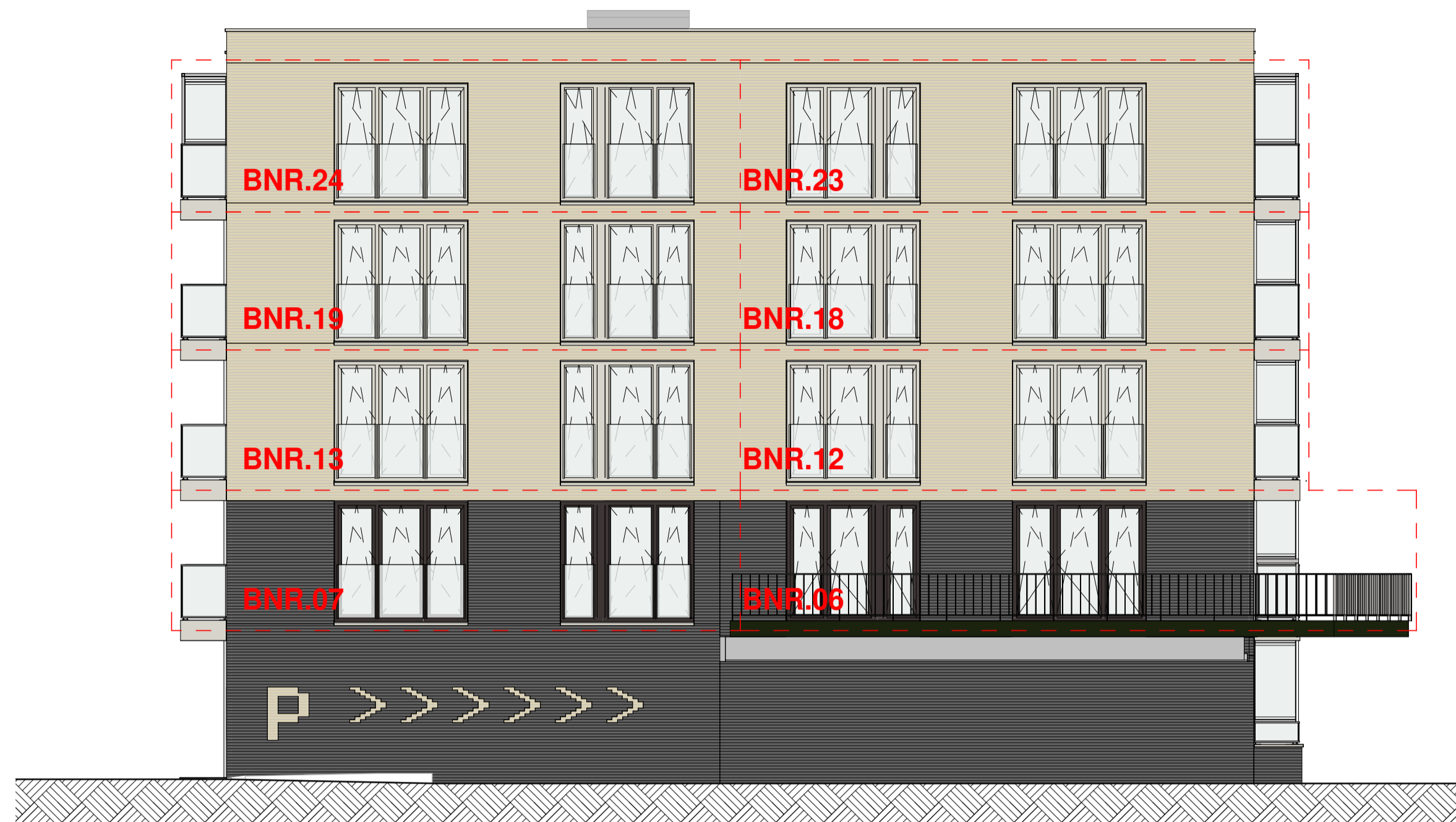
Zuid-oost gevel 1:100