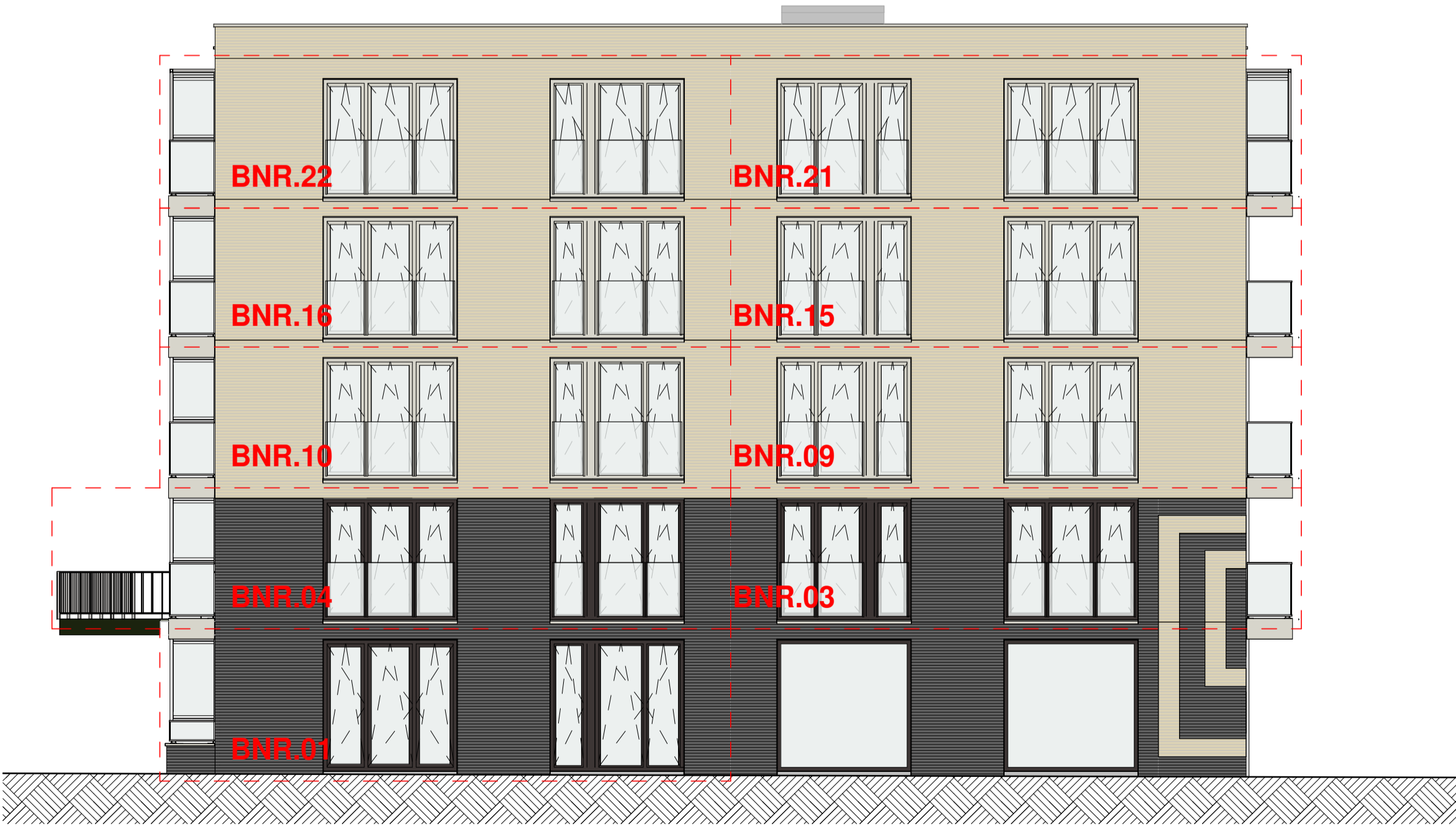
Noord-west gevel 1:100